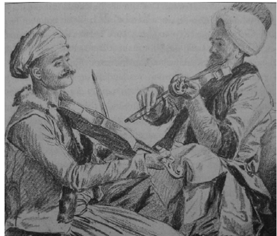
Şekil 5. Kemân, 18. yüzyıl

18. yüzyıl sonlarında saraya giren kemân artan bir rağbetle kullanılmıştır. Yaklaşık 19. yüzyılın