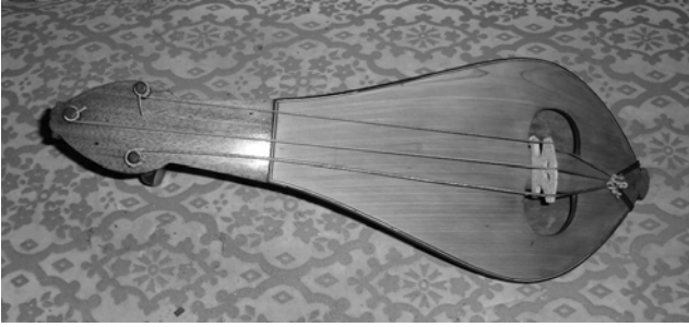
Şekil 3. Topkapı Sarayı'na ait bir armudî kemençe, 19. yüzyıl

Kemân kadar popüler olamasa da saray hayatının sonlarına kadar armudî kemençenin sarayda varlığını koruduğu anlaşılmaktadır.