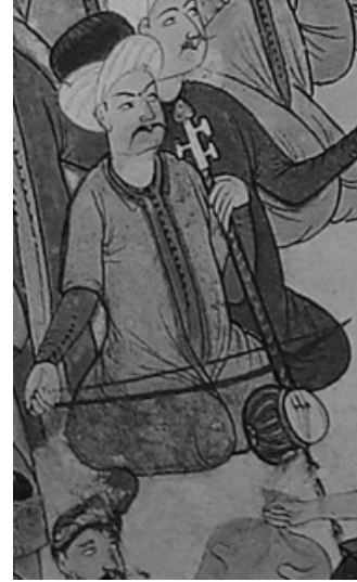
Şekil 1. Kemânçe (rebâb), 18. yüzyıl

Osmanlı müziği tarihinde ve dolayısıyla Osmanlı sarayında 18. yüzyıla kadar mevcut olan tek yaylı çalgı kemânçedir. Uygurlar döneminden beri Türkler tarafından kullanıldığı bilinen ve Türk müziğinde ıklığ , rebâb gibi farklı isimlerle de anılan bu çalgı aynı zamanda çeşitli örnekleri ile birlikte yüzyıllar boyu Orta Asya ve Ortadoğu müziklerinin de en çok kullanılan yaylı çalgısı olmuş ve günümüze kadar da varlığını sürdürmüştür (Sertkaya, 1982; Ögel, 2000). Hindistan cevizi, ağaç veya kabaktan genellikle küre şeklinde bir tekneye ve ona üst tarafından madenî bir çubukla eklenen tahta bir sapa sahip olan kemânçenin tekne göğsü deri ile kaplıdır. 15. yüzyılda iki telli olan kemânçe daha sonra Türk müziğinde hep üç telli olarak kullanılmıştır. Genellikle hindistan cevizinden tekne ve ibrişim teller tercih edilmekle birlikte, teller kiriş veya madenî de olabiliyordu. Kemânçe at kılı takılmış bir yayla ve genellikle oturup teknenin altındaki ayağı yere dayayarak, bazen de ayakta çalınmaktaydı (Şekil 1). İki telli iken genellikle dörtlü aralıkla düzenlenen kemânçenin akordu üç telli olduktan sonra hep şu şekilde olmuştur: - Yegah, Dügah, Neva (Bardakçı, 1986; Farmer, 1997; Fonton, 1987; Hızır Ağa; Yekta, 1986).