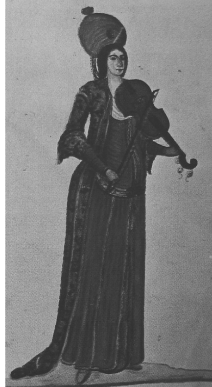
Şekil 4. Sînekemân çalan bir cariyeye, 18. yüzyıl