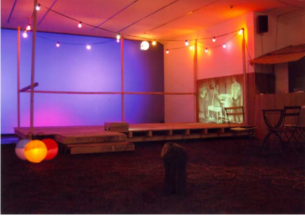
Şekil 4. Lido, 2005, enstalasyon

rinin ana vatanlarına dair anlattıkları hikayelerden yola çıkarak iki kızkardeş kendi yorumları ile hayali bir mekan yaratmışlardır.