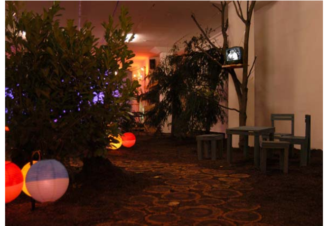
Şekil 3. Lido, 2005, enstalasyon

Kapıdan içeri girildiğinde ise metinde tasvir edilen yerin canlandırıldığı bir enstalasyonla karşılaşılır (Şekil 3, 4). İçerisi karanlık ve sıcaktır, ağustos böcekleri öter, havayı çeşitli kokular doldurur. 1950’li yılların sonlarından bilinen renkli balon ışıklar ile aydınlatılmış bir yol yeşil bir çay bahçesinden geçerek ahşap bir platforma varır, deniz üzerinde ay görülür, platformu neşeli renklerde fenerler aydınlatır. Bu sırada uzakta, 1950 ve 1960’lı yıllardan eski Türk şarkıları çalar. Platformun üzerindeki ekranda eski Hollywood filmleri “Roman Holiday” ya da “Houseboat”tan sahneler izlenir.