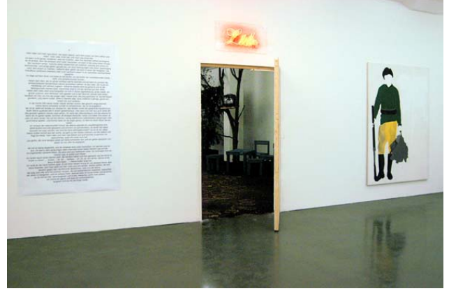
Şekil 2. Lido, 2005, çizim ve hikâye metinleri

Sergi alanında çizimlerin olduğu alan takip edildiğinde bir kapıya varılır; kapının üzerinde ışıklı “Lido” yazısı asılıdır ve kapının solundaki metinde “bir yer”e dair anılardan bahsedilir. Metin, deniz üzerindeki Türk tatlı dükkanları, dondurma, açık hava sinemaları, bir büyükbaba, yazın çocuk olmak gibi konulardan bahseder. Bunlar bellekteki anılardan seçilen belirli parçalardır (Şekil 2).