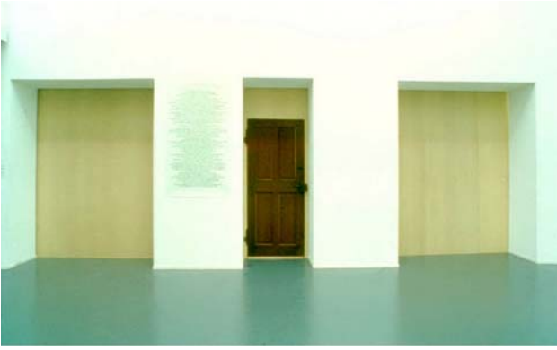
Şekil 5. Arka Pencere (hikaye no.6) , 2004, enstalasyon

Anny ve Sibel'in çalışmalarında bu hatıralara ait parçaların sık sık yer ettiği ve bazı detayların öne çıktığı görülür. İki kardeşin çocukluklarına dair anılarını, dolayısıyla 1970'li yıllarda kalan hayallerindeki vatanlarını canlandırdıkları diğer bir işleri, 2004 yılında, Karlsruhe Badischen Kunstverein'da gerçekleştirdikleri Arka Pencere (hikaye no.6)/Rear Window (story no.6) adlı enstalasyonlarıdır. Sanatçılar bit pazarları ve eski eşya satan dükkanları dolaşarak çeşitli eşyalar toplamışlar, İstanbul'da yaşayan ve birkaç yıl önce ölen teyzelerinin, 1970'li yıllarda Bakırköy'deki evinin bir odasının aynısını, bir köşede divan, duvarında asılı tablo, halı, koltuk, masa, kilim ve perdelerine kadar gerçeğe uygun şekilde galeri mekanı içine kurmuşlardır (Şekil 5, 6, 7).