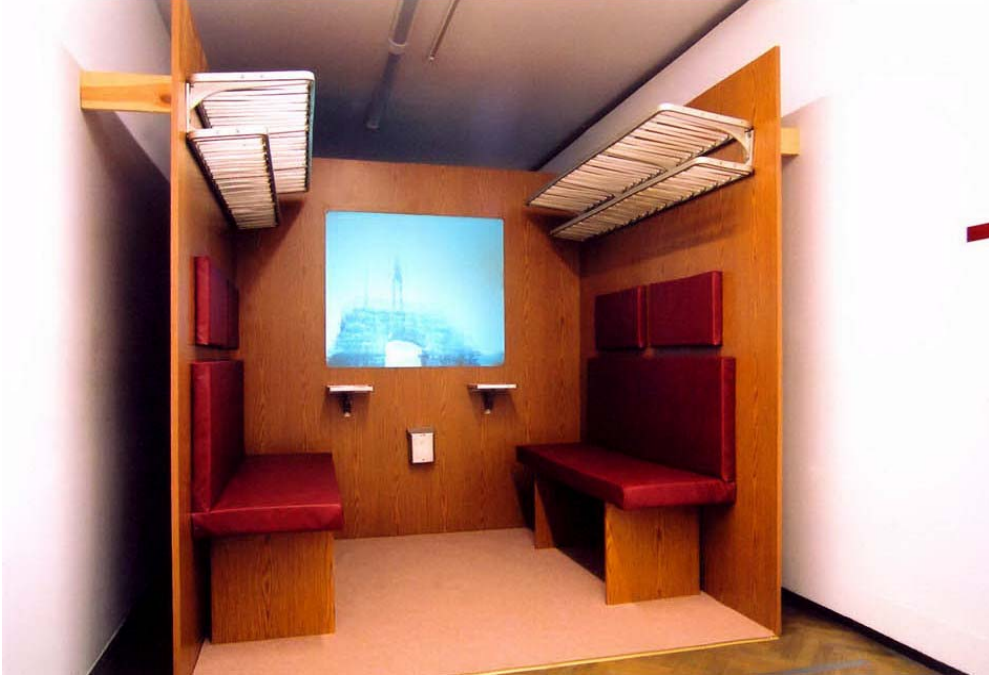
Şekil 1. Bir Yolculuğa Hazırlıklar, 2001, enstalasyon

filmin çekildiği yer belirsizdir, trenin geçtiği yerin Boğaz mı yoksa Neckar mı olduğu sorusu belirsizdir.