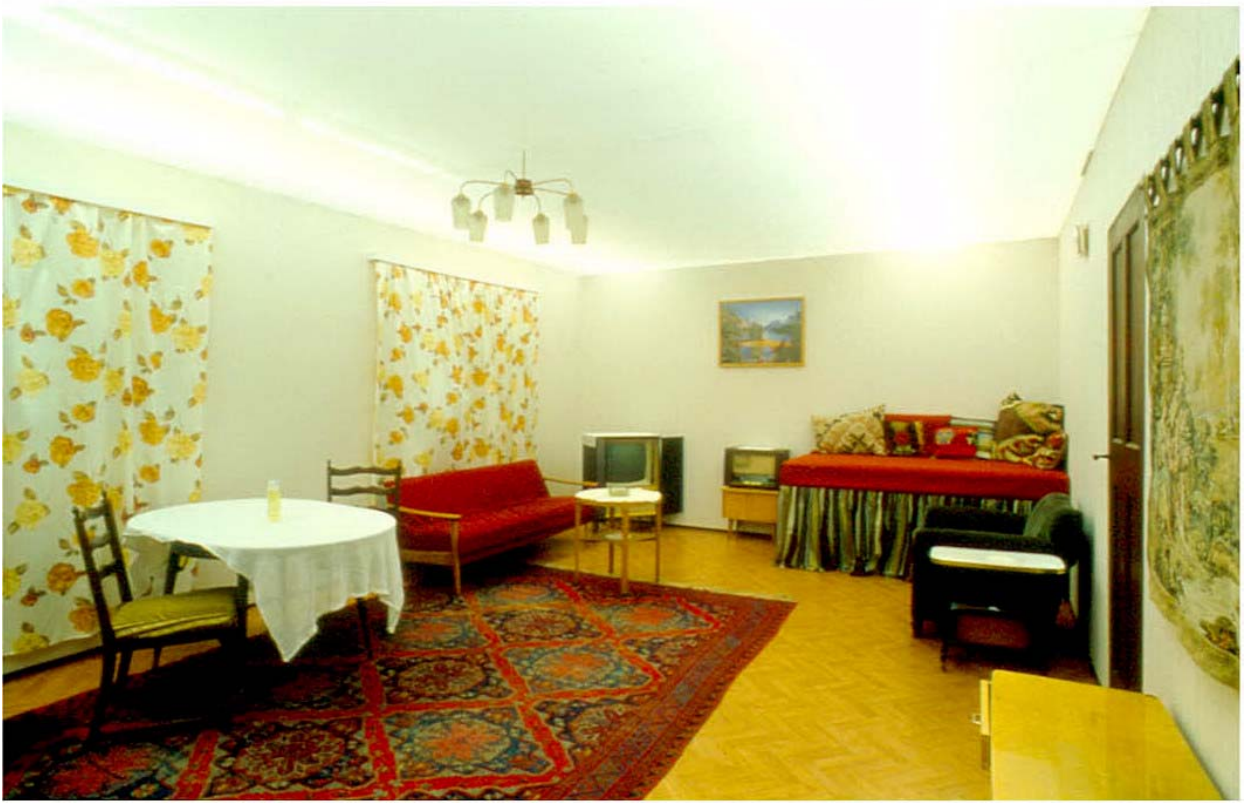
Şekil 6. Arka Pencere (hikaye no.6), 2004, enstalasyon