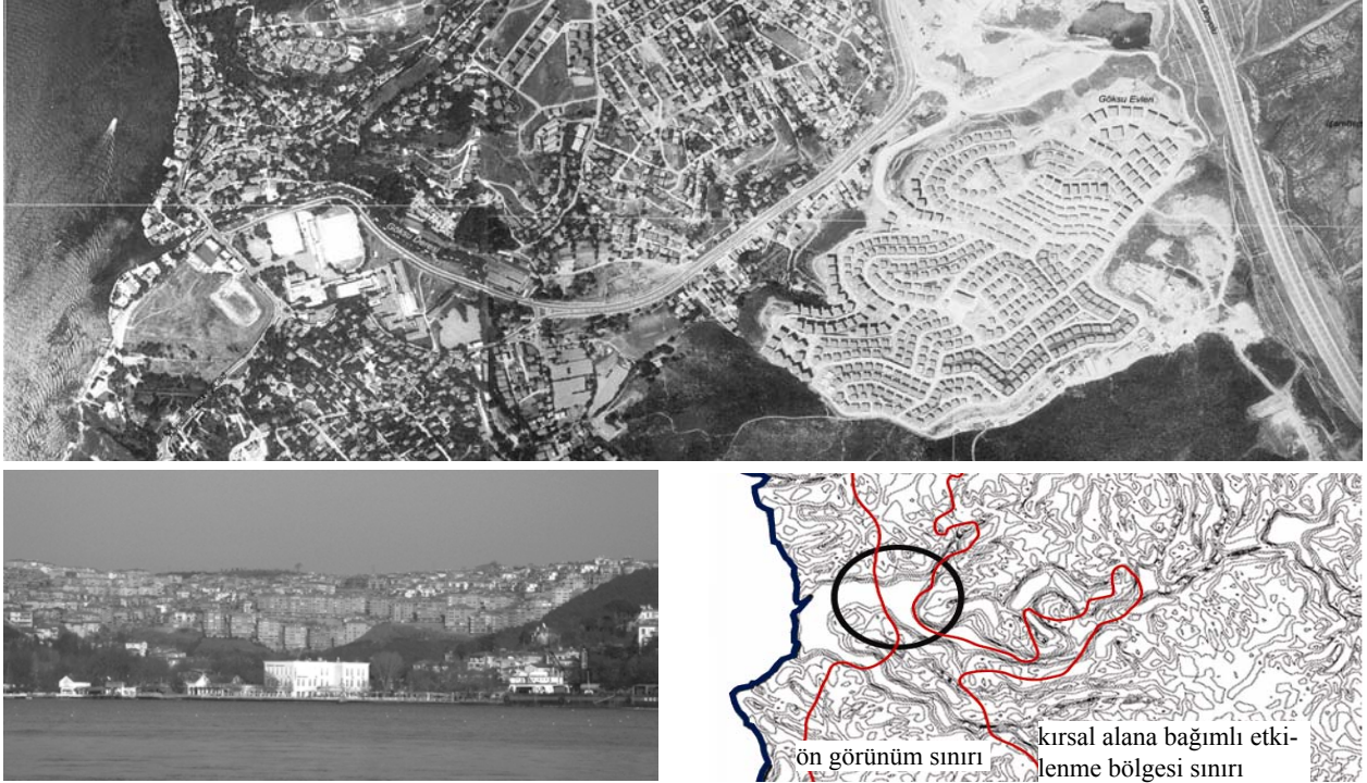
Şekil 1. Kavacık'ta topografyayı bozan yerleşimler

Bu kararlar Boğaziçi'ndeki eski eser tescili taleplerinde ve restorasyon uygulamalarında büyük bir artışa neden olmuştur. Eski eser tescili olmayan binaların yıkıldıkları an yeşil alan statüsü kazanmaları nedeniyle, özellikle öngörünüm bölgesindeki sıradan harap ahşap evler bile restorasyon ve inşaat izni alabilmek amacıyla eski eser olarak tescil ettirilmeye başlanmıştır. Üzerinde bina bulunmayan parsellerde eski eser bulunduğu eski fotoğraf ve belgelerle kanıtlanmaya çalışılarak restitüsyona dayalı restorasyonlarının yapılabilmesi için koruma kurullarına çok sayıda başvuru olmuştur. Yeni yapılaşmanın sınırlandırılmış olması olumlu bir karar olmakla birlikte, restorasyon uygulamalarına bakıldığında, bu dönemde restitüsyon adı altında, hiç var olmamış binaların rekonstrüksiyonun yapılarak yeni “eski”lerin inşa edilmiş olmasının koruma kuramı açısından çok da doğru sonuçlar verdiği söylenemez. Özellikle spekülasyona çok açık ve m 2 'ye aç bir psikolojik yağma ortamında restorasyon ve restitüsyon önerileri çoğu kez kabul edilebilecek nitelikte olmamıştır.