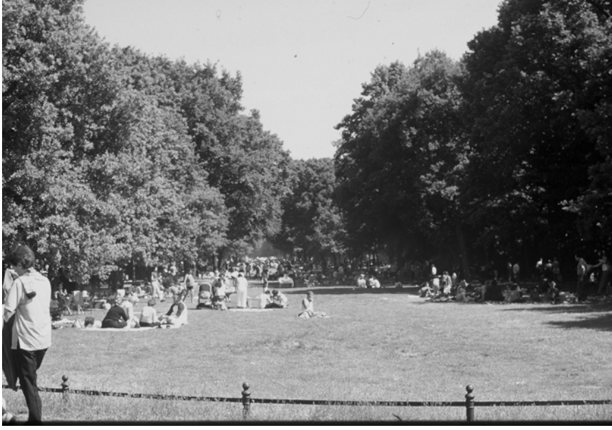
Şekil 2. Berlin 'de Cumhurbaşkanlık Konutu 'nun karşısındaki yeşil alan

Soruların çoğu kapalı uçlu sorular olarak düzenlenmiştir. Anket soruları sınıflamasına göre modeldeki bazı kavramlar açıklanmaya çalışılmaktadır: Aile yapısı ile her ailenin Sosyo-kültürel ve toplumsal kültürel kimlikleri ortaya çıkartılmaya çalışılmıştır. Yani ailenin yapısını, Türkiye'den, nereden ve ne zaman geldikleri, ailenin büyüklüğü ve eğitim durumu saptanmıştır. Ayrıca ekonomik durumları ve meslekleri tespit edilmiştir. Aile yapısı ile, kişisel tespitler yapıldığı için kişilerin kullanıcı kimlikleri ortaya çıkartılmaktadır. Kişilerin doğum yerleri, meslekleri, yaşları, göçün ne zaman gerçekleştiği ve ileriye dönük planların