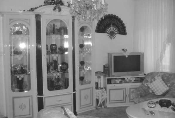
Şekil 4. Ayşe Hanımın evinin salonundan bir görünüş