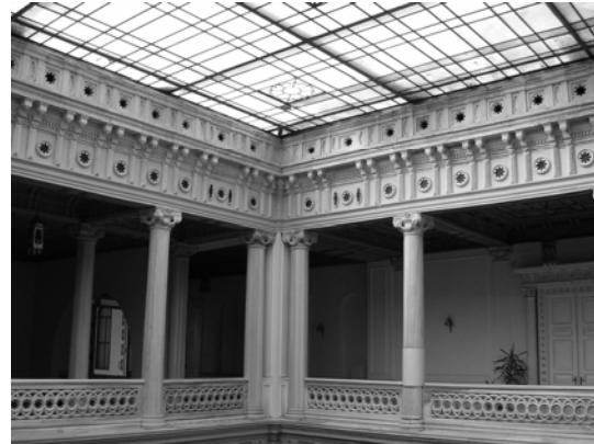
Şekil 8. Bâb-ı Seraskeri iç mekan

Dikdörtgen plan şemasının uygulandığı Bâb-ı Seraskeri Binası, birbirine dik eksenlere göre simetrik. Eksenler, mekanların öne çıkarılmasıyla vurgulanmıştır. Merkezde yer alan sütunlarla çevrili ve camla örtülü avlu ile avlunun iki yanında bulunan anıtsal merdivenler iç mekana ana karakterini vermektedir (Şekil 8).