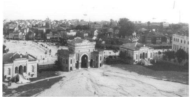
Şekil 10. Bâb-ı Seraskeri anıtsal kapı ve köşkler

vurgulanan girişlerin üst katında ve tüm zemin katta yuvarlak kemerli pencereler kullanılmıştır. Seraskerlik anıtsal giriş kapısı ve iki yanındaki köşelerde ise, at nalı, sivri ve dilimli kemerler ile oryantalist bir tasarım anlayışı hakimdir (Şekil 10). Oryantalist üslubun Avrupa ile gelişen ilişkiler 5 ve Abdülaziz'in kişisel tarzı sayesinde 1860'lar İstanbul'unda bir patlama yaşadığını kaydeden Batur (1994), Mustafa Reşid Paşa Türbesi'nin İstanbul'da tarihi bilinen en erken oryantalist yapı olduğunu belirtir ve 1863'te Sultanahmet Meydanı'nda açılan Sanayi Sergisi binasının oryantalist eğilimin kamuoyu tarafından benimsenmesinde önemli bir payı bulunduğu dikkat çeker. Oryantalist tasarım, Bahriye Nezareti cephelerindeki mimari bileşenlerde de gözlenmektedir. Cephe biçimlenmesinde, sütun başlıkları, piyestaller gibi Batılı mimari elemanların yanı sıra, at nalı, soğan biçimli ve dilimli kemerler, başlık üzerinde yükselen tablalar gibi Doğu mimarisine özgü elemanlar kullanılmıştır (Şekil 3).