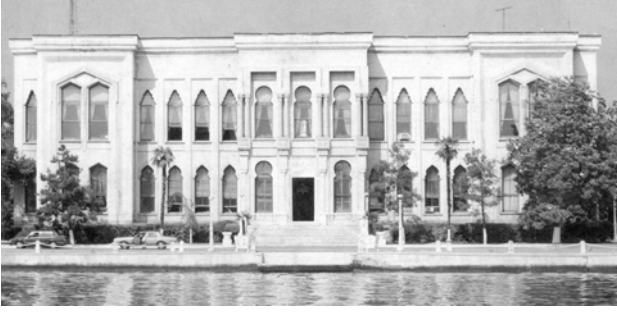
Şekil 3. Bahriye Nezareti, denizden görünüm

arasında Bourgeois tarafından kagir olarak inşa edilmiştir (Tanyeli, 1994). Diğer bakanlık binası ise, Bahriye Nezareti'ne aittir (Şekil 3). Divanhane olarak adlandırılan Kaptanpaşa Köşkü'nün yerine, 1865-1867'de kagir olarak inşa edilen binanın mimarı olarak Vasiliki ve Anastas Kalfa adları geçmektedir, ancak yapının adı Sarkis Balyan'ın inşaat listesinde bulunmaktadır (Batur, 1982).