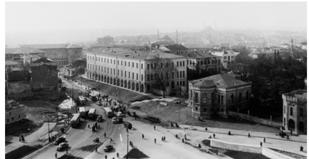
Şekil 5. Fuad Paşa Konağı, 1950 civarı

Tanzimat'ın üçüncü adamı Fuad Paşa'nın Bâb-ı Seraskeri'nin Vezneciler tarafındaki konağı ise (Şekil 5), paşa ile Abdülaziz arasında yaşanan bir gerginlik sonrasında devlete geçmiştir (Şeref, 1329). Yapımında Bourgeois ve Barborini'nin görev aldığı Fuad Paşa Konağı (İ.DH. 42727), Şehremaneti ve Zaptiye idareleri tarafından istenmesine karşın, 1870'e doğru Darülfünûn'u terkeden Maliye Nezareti'ne verilmiş ve arkasına iki bina daha eklenmiştir. Darülfünûn'a ise, harap binalarda bulunan Ticaret, Evkaf ve Maarif nezaretlerinin taşınması önerilmiştir (Hayta, 2002). 1876'da Mebusan ve Ayan meclislerine ev sahipliği yapana kadar bu nezaretlere verilen yapıya, 1878 Bâbıâli yangını sonrasında Evkaf Nezareti'nin yanı sıra Adliye Nezareti de yerleşmiştir (İhsanoğlu, 1990).