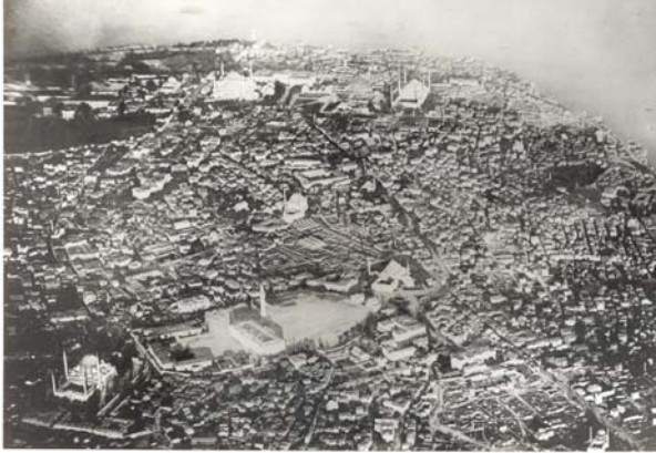
Şekil 7. Tarihi Yarımada havadan görünüm

ması ve boyutları olmuştur (İ.DH. 39914). Bulduğu mekana hakim konumdaki yapının, Beyazıt meydanını sınırlayan ve tanımlayan kütleli, idari yapı olarak seçilmesinde karakteristik bir unsur olarak düşünülebilir. Ön cephede yer alan revaklı bölüm, yapının kentsel alana entegre olması açısından dikkat çekmektedir. Resmi yazışmalarda inşaatından bahsedilen dükkanlar göz önüne alındığında, bu yarı açık mekanın toplum hayatının bir parçası olarak düşünüldüğü ve yapıya canlılık kazandırdığı öne sürülebilir (Şekil 5). Fuad Paşa Konağı'nın ilerisinde, 1808 ve 1839 yangınlarında Bâbîâli görevlilerine ev sahipliği yapmış konakların yerinde bulunan Zeyneb-Kamil Konağı (Şehsuvaroğlu, 1956), Şehremaneti idaresinin geçmek istediği bir diğer binadır. Yapı, idari açıdan toplumsal hafızada yer etmiş bir alanda bulunması ve kütleli ölçüğü ile, sahiplerinin iktidar merkezine olan yakınlığını belgelemektedir.