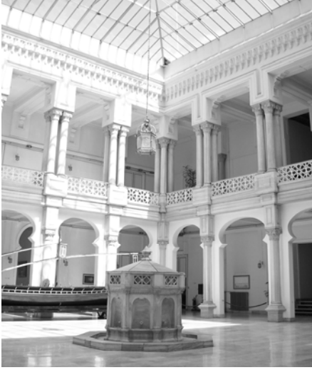
Şekil 9. Bahriye Nezareti iç mekan

şekilde bir araya getirilmiş sütun başlıkları, piyedestaller gibi Batılı mimari unsurlar, sütun başlığı üzerinde dikine yükselen tablolar, dörtlü sütun grupları, basık at nalı biçimli kemerler gibi Doğu'ya referans veren elemanlar ile kombine edilmiştir (Şekil 9).