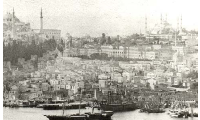
Şekil 1. Bâbiâli binasının Haliç'ten görünümü

Bu süreçte, 1839'de yanmış olan Bâbiâli Binası, 1842-1844 arasında, Stefan Kalfa tarafından kagir olarak inşa edilmiştir (Şehsuvaroğlu, 1956). Harem kısmı yapılmadan, bakanlık ve meclislere mekan oluşturacak şekilde, konut özelliğinden sıyrılarak Avrupalı görünümde inşa edilen bina, iki yanda Dahiliye, Hariciye ve ortada Şurâ-i Devlet bölümleriyle, Tanzimat Dönemi idari mekanizmasının merkezi olmuştur (Şekil 1). 19. yüzyılda son şeklini almadan önce birkaç yangın geçiren Bâbiâli, Tanzimat Dönemi'ni başında (1839) ve sonunda (1878) geçirdiği birer yangınla atlatmıştır. Buna karşın, arşiv kayıtlarından izlenebildiği kadarıyla, 1839-1876 arasında, neredeyse her yıl, belli bir bölümü onarılan, genişletilen veya yeni daireler için tekrar düzenlenen yapı, Tanzimat Dönemi'nin nazik siyasi dengesi ve bürokratik yapılanmasının mimari göstergesi niteliğindedir.