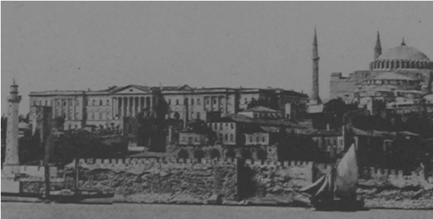
Şekil 2. Darülfünûn Binası

1846'da Fossati tarafından yapımına başlanan bir diğer bina, üniversite eğitimi amacıyla inşa edilmesi kararlaştırılan Darülfünûn'dur (Şekil 2). Yapımı uzun bir döneme yayılan, Kırım Savaşı süresince hastane olarak kullanılan, sonrasında göçmenlerin yerleşimine açılan bina, 1860 civarında tamamlanmış, iki yıl kadar serbest konferanslara ev sahipliği yaptıktan sonra, 1865'te Maliye Nezareti'ne verilmiştir (İhsanoğlu, 1990). Dini anlamı yüksek bölgede modern bir eğitim sisteminin kurulması amacıyla yapımında ısrar edilmesi, dönemin idareci ve aydınlarının simge yapı konusundaki tutumunu ortaya koymaktadır. Konumu nedeniyle tartışmalara yol açan yapı, inşaatın bitiminden kısa bir süre sonra nezaretlerin yerleşimine verilmiş ve idari alandaki soyut görevini fiziksel anlamda da yerine getirmiştir.