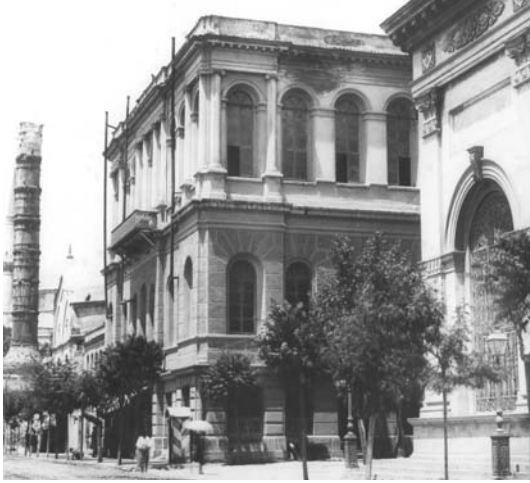
Şekil 6. II. Darülfünûn Binasi

Tanzimat Dönemi idarecileri, öğrenci talebini karşılamak için çok büyük olan Darülfünûn'un nezaretlere verilmesi üzerine, üniversite eğitiminin sağlanması amacıyla tekrar çaba göstermişlerdir. II. Darülfünûn adını alan yeni üniversite binası (Şekil 6), daha mütevazî ölçülerde Barborini tarafından inşa edilmiş, ancak iki sene kadar devam eden dersler sonucunda, Mülkiye Mektebi'ne ve Maarif Nezareti'ne verilmiştir (İhsanoğlu, 1990).