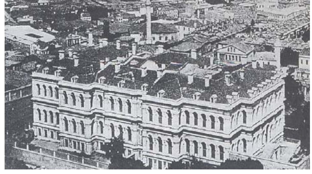
Şekil 4. Âli Paşa Konağı

inşa edilen, Tanzimat'ın ikinci adamı Âli Paşa'ya ait konak (Şekil 4), Vefa'da Abdülaziz dönemi sadrazamlarından Mütercim Rüştü Paşa Konağı, Cağaloğlu'nda sadaret müsteşarı Bülbül Tevfik Paşa Konağı ve Tanzimat'ın fikir bazında öncülerinden Sadık Rıfat Paşa'nın ahşap konağı yerine oğlu tarafından yaptırılan Rauf Paşa Konağı ile Beyazıt'ta Midhat Paşa Konağı'dır.