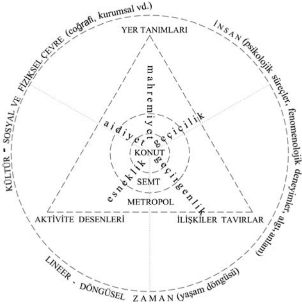
Şekil 2. Bağlamsal Çerçeve

sorgulamalarına da araç ' olmaktadır. Bu çalışmada tümevarımcı ve yorumlayıcı bir yaklaşım benimsenmiş; araştırmanın tek seferlik ve keşfedici olması hedeflenmiştir.